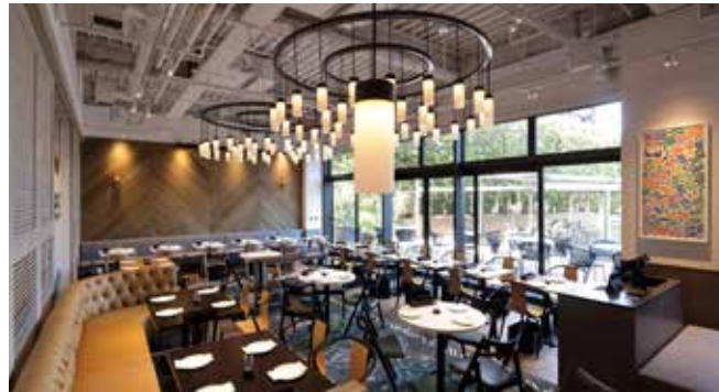
全350席の「RIDE」では水辺の立地を活用した様々なイベントを開催予定

9月には青山一丁目駅直結の「青山ビルディング」リニューアルに伴い誕生した「青山一番街」において、ちゃんと美味しいものを日常に楽しめる大人の居酒屋「否否三杯(イヤイヤサンバイ)」をオープンしました。京都の名店「草喰なかひがし」の主人・中