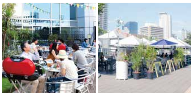
夏の期間限定で屋外空間を活用したオープンテラスカフェ、ビアガーデンを出店

上半期、相次ぐ台風や記録的な大雨によるテラス席の稼働率減少は、外部環境を取り込んだ気持ちの良い空間を生み出してきた私たちにとって、とても苦しい経験でした。だからこそ、天候