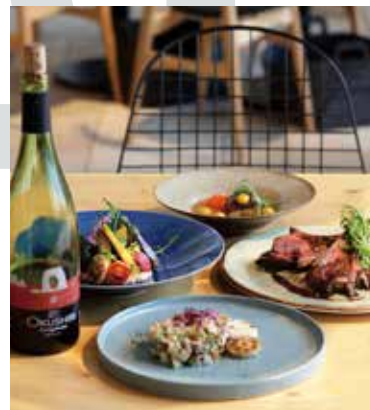
「ニッポンのテロワールを体感」をテーマに全国各地の食材を発掘し、メニュー展開する「DRAWING HOUSE OF HIBIYA」

によるテラス席活用のノウハウをより蓄積することができたと思っています。また、M&Aという今までにない形での異文化の融合とコミュニケーションは、改めてバルニバービを客観的に捉えることができました。私たちだからこそ強みや弱みを理解し、戦略的に進んで行くきっかけの1年でした。